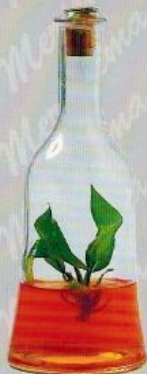
Art. 19 LILLA cc 500 • cm. 22