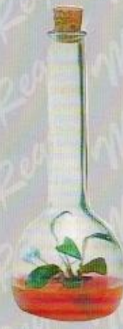
Art. 15 TULIPANO PICCOLO cm. 21