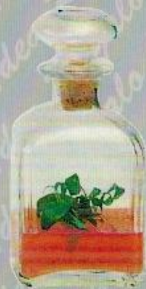
Art. 27 PARMA cm. 20