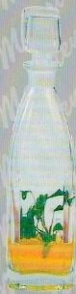
Art. 38 BRIO cm. 32