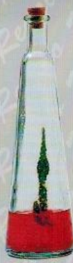
Art. 21 FRAGOLA cm. 17