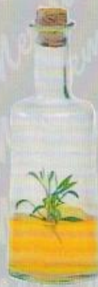
Art. 16 PRIMULA cc 200 • cm. 16