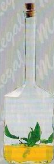
Art. 30 ARCOBALENO cm. 31