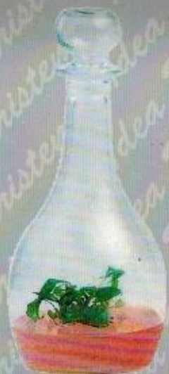
Art. 37 EXECUTIVE C/T cm. 30