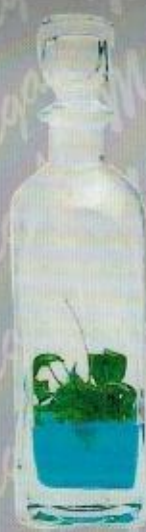
Art. 34 STRAUSS cm. 29