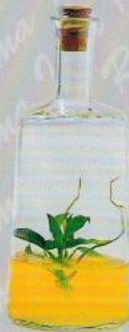
Art. 17 PRIMULA cc 500 • cm. 20