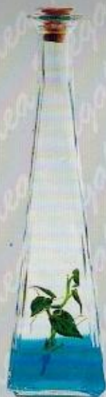
Art. 14 PIRAMIDE cc 200 • cm. 22