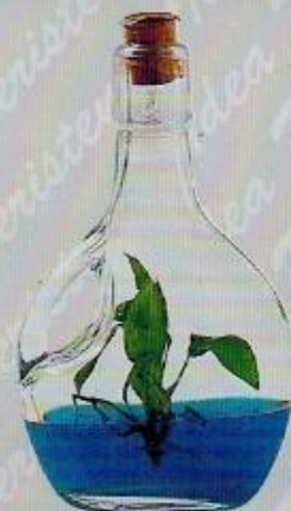
Art. 11 BASQUAISE CON MANICO cm. 17