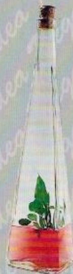
Art. 31 PALAZZO cm. 31