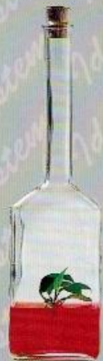
Art. 28 AURORA cm. 31