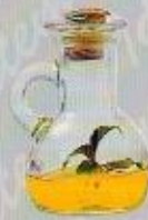
Art. 9 ARROGANCE PICCOLO cm. 9,5