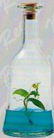
Art. 18 LILLA cc 200 • cm. 16