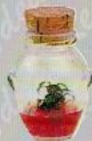
Art. 3 ORCETTO PICCOLO cm. 8