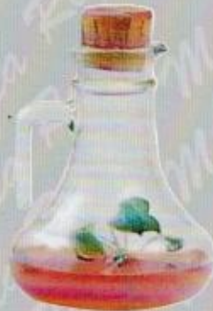
Art. 26 BROCCA FRANCIA G. cm. 16