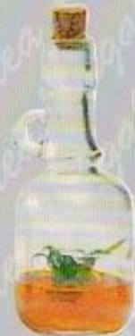
Art. 24 GALLONE cm. 18