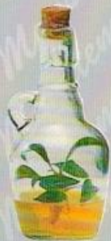
Art. 23 ANFORA cm. 16