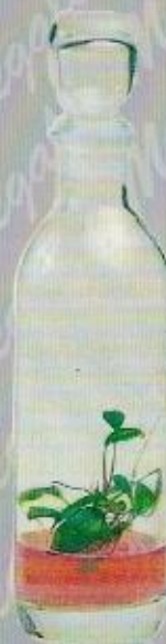
Art. 35 BACH cm. 31