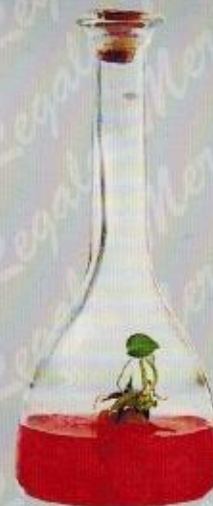
Art. 22 BERNA cm. 18