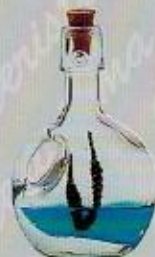
Art. 2 Serie MIGNON G cm. 11