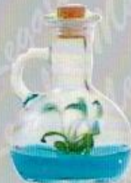
Art. 10 ARROGANCE GRANDE cm. 12