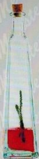
Art. 13 PIRAMIDE cc 100 • cm. 17