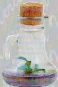
Art. 25 BROCCA FRANCIA P. cm. 13