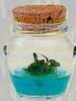
Art. 5 ORCETTO GRANDE cm. 8