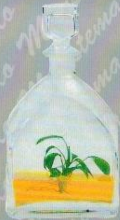
Art. 32 CELLINI cm. 25