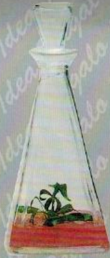
Art. 33 VINCIANA cm. 31

Azienda Agricola Meristema srl • Laboratorio di Micropropagazione Località Riaccio - 56030 Cascine di Buti (Buti - Pisa) Italy