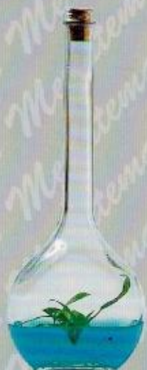
Art. 29 TRAMONTO cm. 31